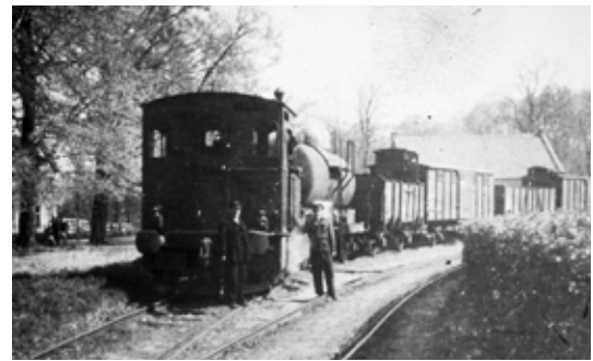
Goederentram bij Naarden Aanrijding